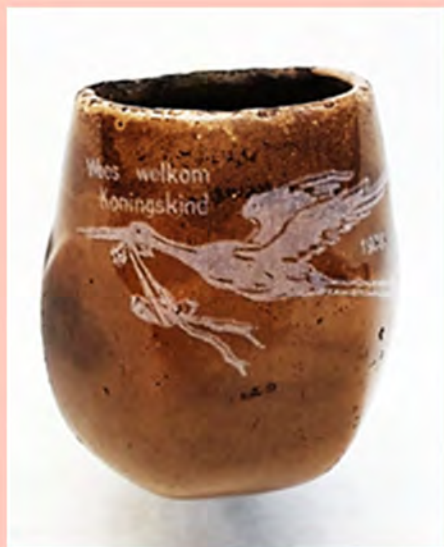
Hergebruik van een 'Oranje huis' transfer. Pagina 6