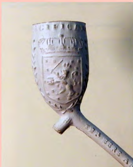
Een persvorm en tabakspijpen van de Pacifictie van Gent, 1576-1876 (1976) Pagina 14