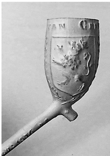
Afb. 2. Pacificatie- pijp, Zenith, Firma P.J. van der Want Azn., 1976. Collectie Tabaks- historisch Museum Delft, foto Bert van der Lingen.