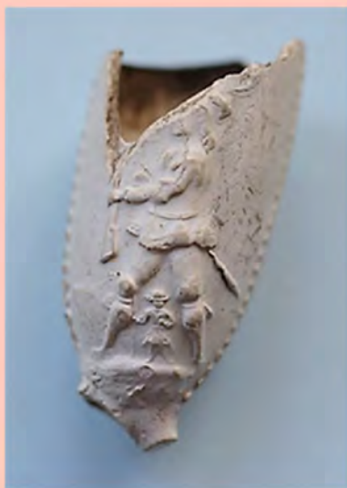
Opvallend pijpje uit onrustige tijden Pagina 3