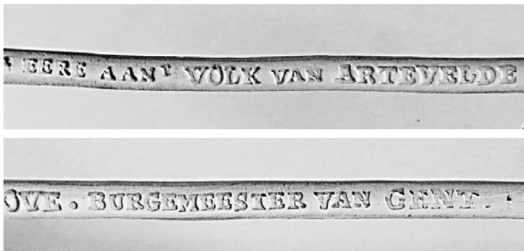
Afb. 3. Detail van de pacificatiepijp in afb. 2. Collectie Tabaks-historisch Museum Delft